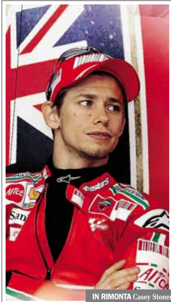
IN RIMONTA Casey Stoner

Motomondiale: l'australiano super con la Ducati Valentino scatta terzo dietro Pedrosa. Il Gp alle 14