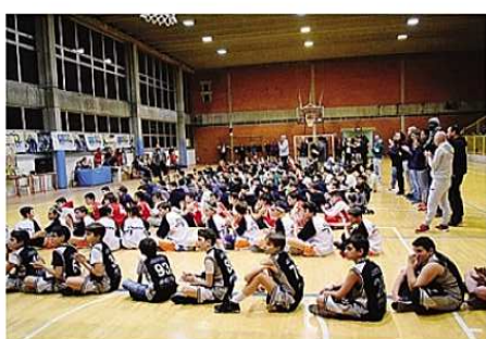
Oltre 250 mini cestisti in campo per il Memorial Raffa Martini

Nella tre giorni di gare al Pala-Raffa Martini di Torre Boldone, alla Fiumar Arena e alle palestre del Vittorio Emanuele, a Bergamo, numeri importanti anche per quanto riguarda le squadre partecipanti (sedici) e gli atleti (oltre 250).