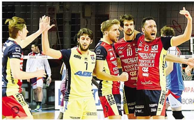
Esultano i giocatori della Caloni Agnelli: nella prossima stagione la squadra giocherà in serie A2