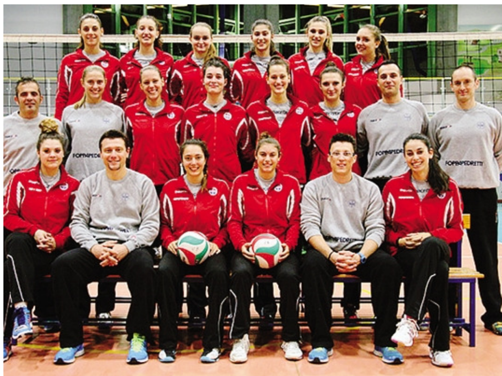
Le ragazze della Foppapedretti Under 18, anche nel prossimo campionato in B1

L'altra squadra di B1 femminile, la neopromossa Don Colleoni