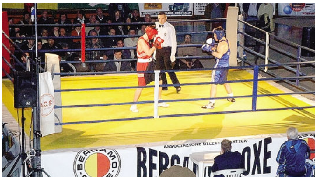
La grande boxe oggi torna all'Italcementi: in palio un titolo italiano e uno europeo

Subito prima sarà la volta del campionato italiano superlegge-