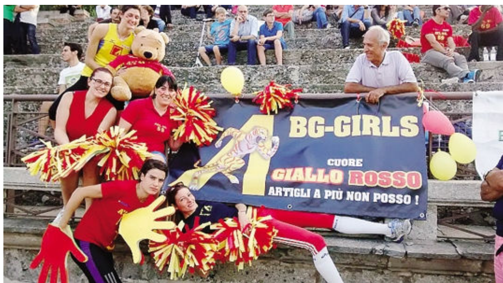
Le «tigri» giallorosse mostrano gli artigli all'Arena di Milano. In tribuna ma soprattutto in pista