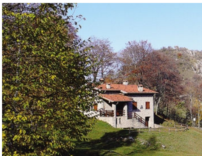
Il Rifugio Gesp è uno dei punti di passaggio della Scalata dello Zucco

L'organizzazione è del Gruppo escursionisti San Pellegrino Gesp con patrocini vari, con l'assistenza tecnica dei tecnici Fidal e la gestione del cronometraggio alla sezione bergamasca della Federazione italiana cronometristi. Sono ammesse alla gara le categorie promesse, senior e master. Il percorso di gara