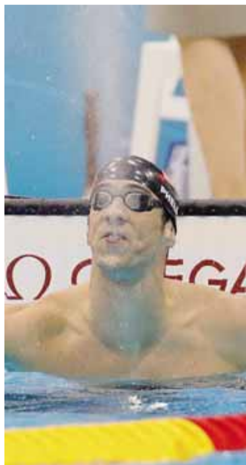
Per Michael Phelps oggi ultima gara nella 4x100 mista