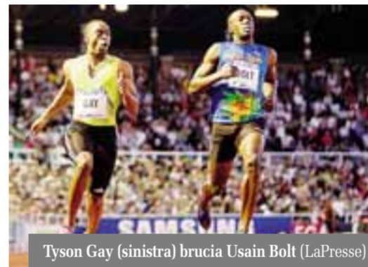
Tyson Gay (sinistra) brucia Usain Bolt

za più breve da due anni e si vede che la pista di Stoccolma non gli porta bene. Era stato battuto anche allora, infatti, nella capitale svedese, ad opera del connazionale Asafa Powell, ieri sera assente nella sfida stellare. Il record del mondo sui 100 metri piani resta fermo al 9"58 firmato dallo stesso Bolt ai Mondiali di Berlino il 16 agosto 2009.