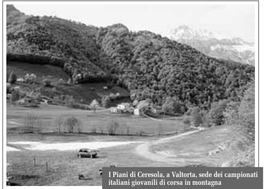
I Piani di Ceresola, a Valtorta, sede dei campionati italiani giovanili di corsa in montagna